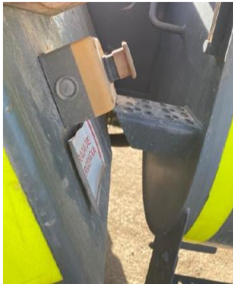
Figura 2.4: Imagen del botón de parada de emergencia.

La función principal del dispositivo de parada de emergencia es la de parar la máquina lo más rápidamente posible.