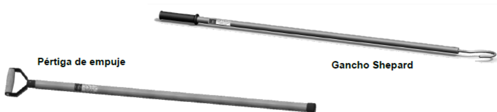
Figura 2.2: Imagen del Kit manos libres

Los venteros deben estar visibles para el Rigger o en comunicación radial y ser previamente capacitados. Solo en casos evaluados en el Análisis de Riesgo (ART) y bajo planificación, el Rigger puede acercarse para tareas específicas como montaje de estructuras, cañerías o descargas. Está prohibido enrollar cuerdas en el cuerpo, y si la carga no permite el uso de vientos, se debe emplear un kit manos libres (pértiga y gancho Shepard) para su direccionamiento seguro.