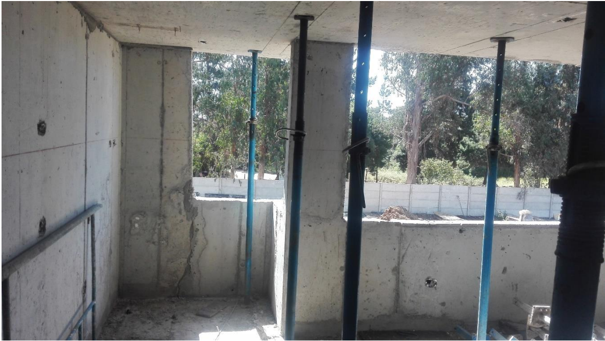
Figura 2.5 descarachado y pulido de la losa