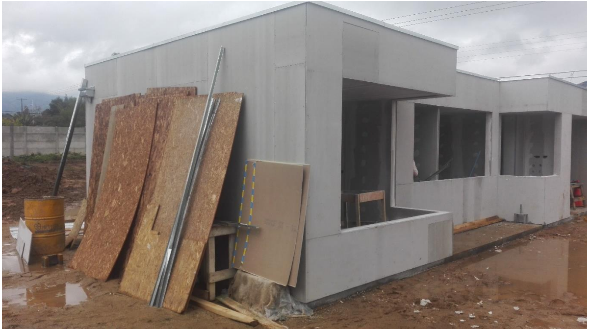
Figura 2.1 Piloto en construcción