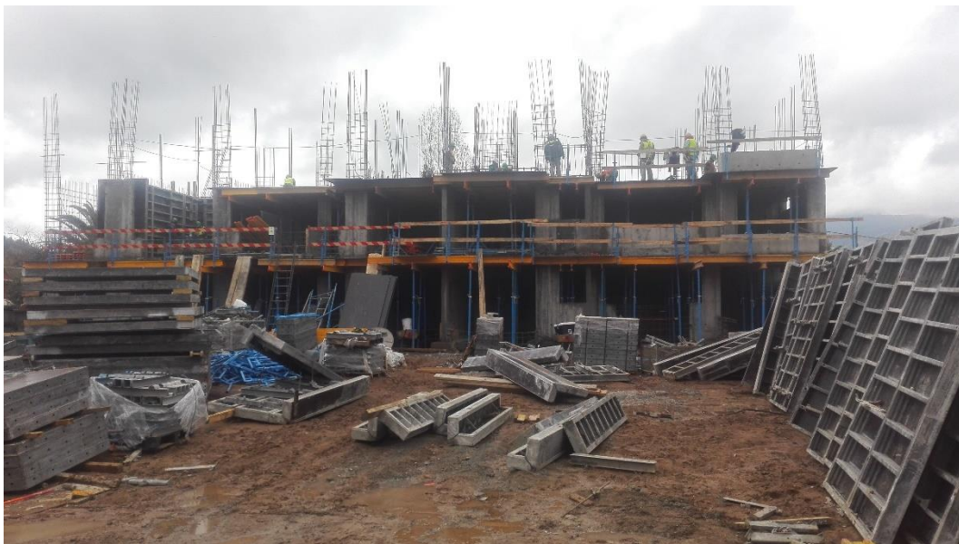
Figura 1.2 Inicio obra gruesa

La supervisión de los alumnos se centro principalmente en los estados de los muros de la obra gruesa, ya que uno de los primeros procesos que se efectuarían era la colocación del yeso y para que se concretara de manera efectiva tenía que tener un buen pulido y descarachado, no podía existir ninguna muestra del fierro en los muros ni tampoco partes de hormigón u elementos de la obra gruesa que sobresaliera de este.