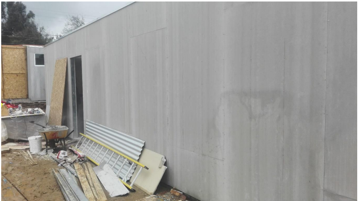
Figura 2.2 piloto vista oriente