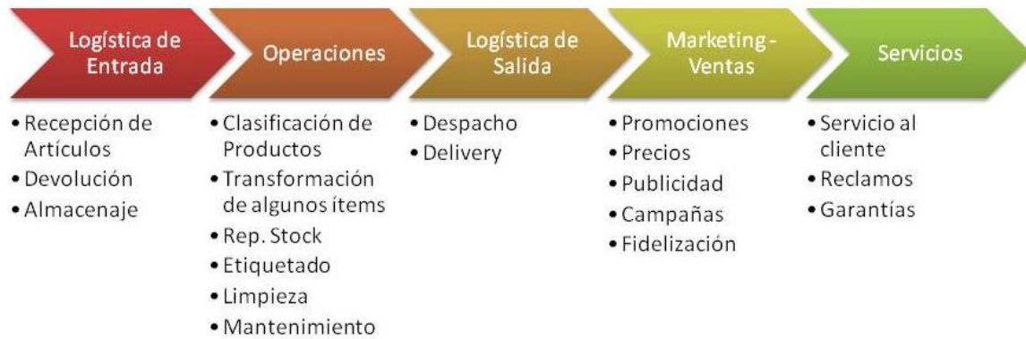
Ilustración 4: Áreas de la cadena de valor.