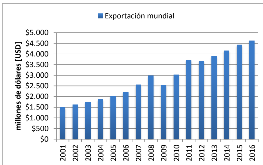
Ilustración 2: Exportación Mundial de Aceites Esenciales Siglo XXI

El comercio mundial de los aceites esenciales empleados en la industria de sabores (licores y bebidas), perfumes y fragancias es creciente (del orden de 8,17% anual).