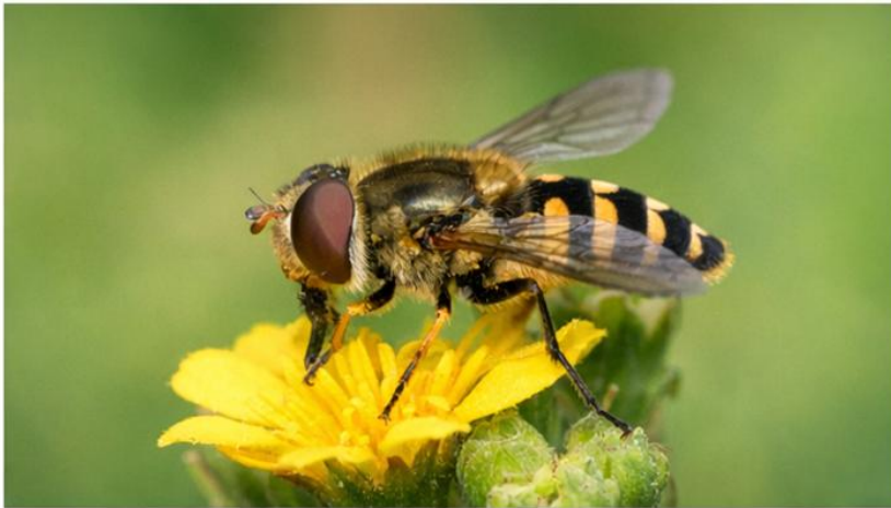
Sírfido (Syrphidae): Polinizador y sensible a la contaminación.