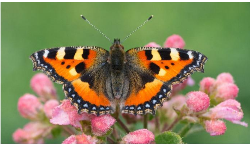
Mariposa (Nymphalidae): Sensible a cambios de hábitat y contaminación.