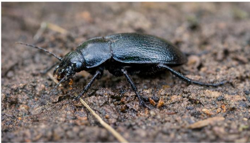
Escarabajo (Carabidae): Bioindicador de acumulación en suelos.