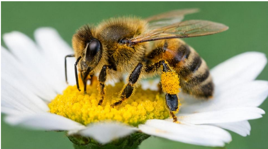
Abeja ( Apidae ): Indicadora de metales pesados y plaguicidas.