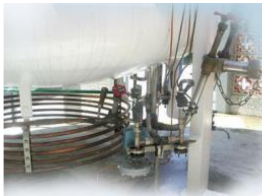
Ilustración 15, Válvulas de Alivio

El propósito del circuito principal de válvulas de alivio del tanque es aliviar el exceso de presión del tanque interno si la presión excede la MAWP (presión de trabajo máxima permitida) del tanque.