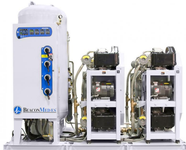
Ilustración 1, Compresor Scroll