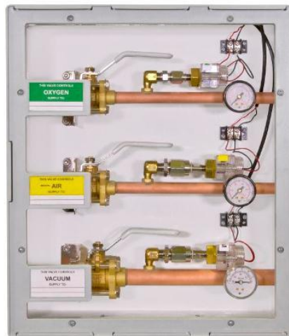
Ilustración 7, Caja de Válvulas

Sitios físicos donde se ubican los puntos de corte de las redes de los gases medicinales. Se utilizan para realizar un corte del suministro en forma oportuna en caso de emergencia o para hacer mantenimiento y reparaciones de equipos.