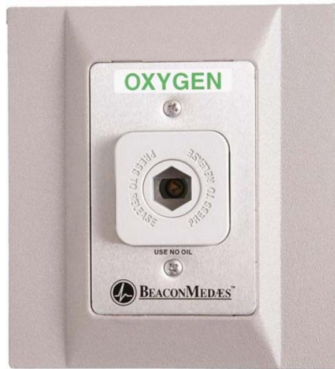
Ilustración 5, Tomas Murales

Puntos murales de suministro interno (salidas) de los gases medicinales, en el área de uso de éstos.