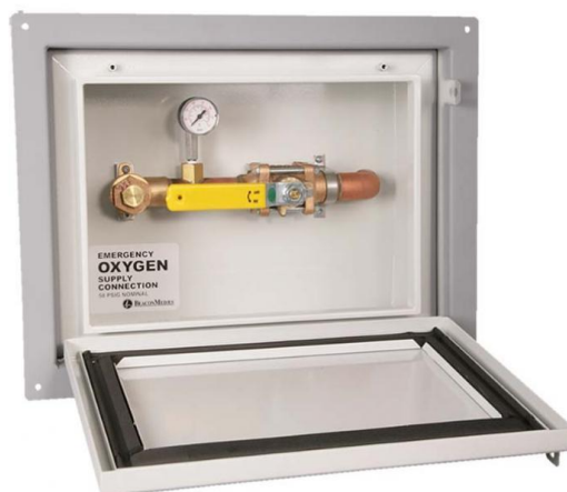
Ilustración 9, Caja de Respaldo de Oxígeno

Las tomas de oxígeno de emergencia proporcionan una conexión para una fuente auxiliar de oxígeno al hospital en situaciones de emergencia o mantenimiento. La construcción robusta y robusta proporciona protección contra los elementos y se puede asegurar para evitar el acceso no autorizado.