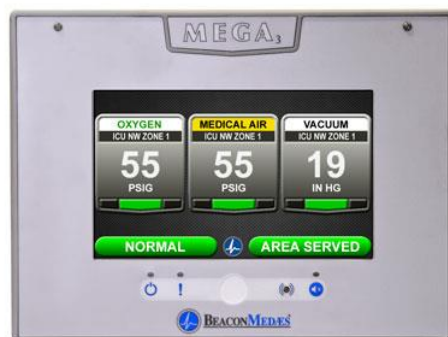
Ilustración 6, Alarma de Gases

Equipos que permiten medir y monitorear la presión de los diversos gases en las líneas que van a los distintos puntos de consumo. Emiten señales audiovisuales en caso de que se produzcan fluctuaciones de la presión por debajo o por sobre el rango normal de las presiones de los gases.