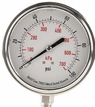
Ilustración 13, Manómetros de Línea

Accesorios que permiten visualizar las distintas presiones que se manejan en el sistema.