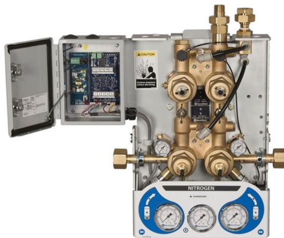
Ilustración 3, Manifold

Sistema de respaldo en el suministro de gases al centro hospitalario. Esta batería de respaldo está conformada por grupos de cilindros que pueden contener alguno de los gases de uso clínico. Ya sea, Manifold o múltiple de cilindros de Oxígeno, Óxido Nitroso, Nitrógeno u Oxido Carbono. Pueden ser además otros gases fuera del oxígeno, no es el conjunto de llaves para administrar los flujos.