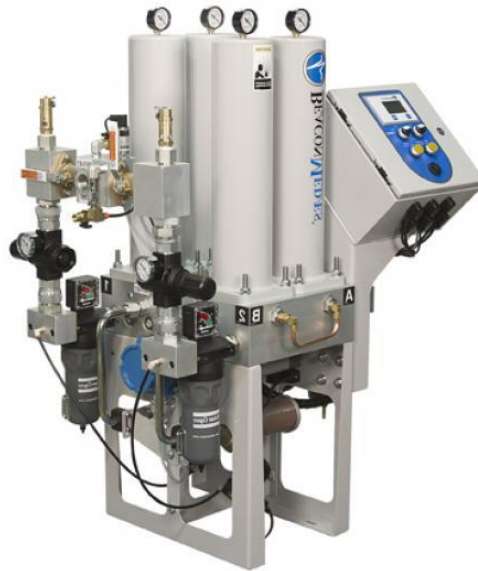
Ilustración 4, Secadores

Máquinas para extraer la humedad al aire que será utilizado en los procedimientos hospitalarios.