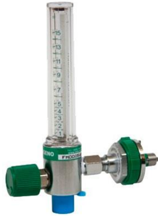
Ilustración 10, Flujómetro

Dispositivos que se pueden acoplar a las tomas murales, ya sea de aire u oxígeno, para dosificar la cantidad de gas entregado al paciente. La unidad de flujo más usual es el L / min.