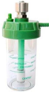
Ilustración 12, Humificador de muro

Recipientes utilizados para aportar humedad al oxígeno indicado al paciente y así evitar resequedad de sus mucosas. Se ubican luego del flujómetro para hacer pasar el oxígeno por el líquido que contiene el humidificador y crear burbujas, lo que provoca la humectación del gas.