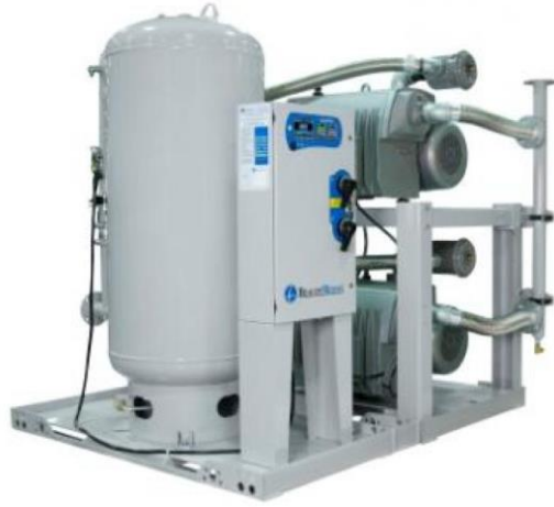
Ilustración 2, Bomba de vacío

Equipos para producir presión negativa, la que se transmite a través de las redes de distribución y se traduce en fuerza aspirativa para ser usada en diversos procedimientos médicos