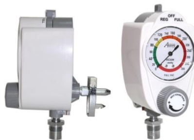
Ilustración 11, Reguladores de Vacío

Dispositivos que se pueden acoplar a las tomas murales, ya sea de aire u oxígeno, para dosificar la cantidad de gas entregado al paciente. La unidad de flujo más usual es el L / min.