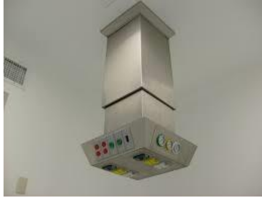
Ilustración 8, Columna de gases

Equipos primarios para el suministro de gases dentro de las salas hospitalarias, donde se requiere optimizar el espacio y facilitar el uso de los gases medicinales a los usuarios.